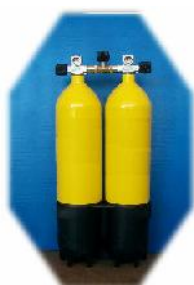
TABLA Nº 6.- BIBOTELLAS con MANIFOLD AISLADOR