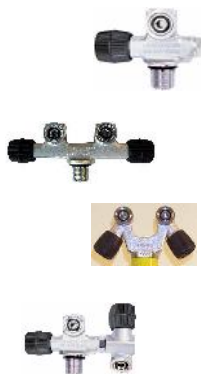
TABLA Nº 5.- COMPLEMENTO VÁLVULA