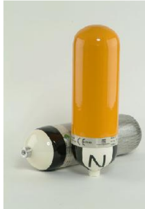
TABLA Nº 01.- BOTELLAS COMPOSITE LUXFER int. aluminio, Válvula gama alta VTI