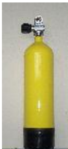
TABLA Nº 4.- Botellas con VÁLVULA mono LS y CULOTE.